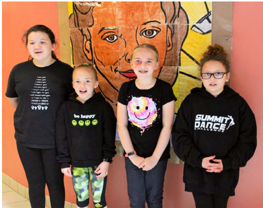
PLUS BAS ET DROITE : Les élèves apprennent à propos des réussites de personnes d'ascendance africaine ayant défriché le chemin pour les générations futures.