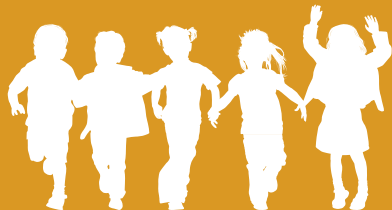
Lydia, 3e année