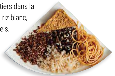
Figure 6. Assiette du Guide alimentaire canadien (aliments à grains entiers)

La personne titulaire de permis ou sa remplaçante peut incorporer de tels aliments à sa discrétion pour faciliter l'inclusion et la représentation d'aliments culturellement adaptés aux enfants au sein du programme.