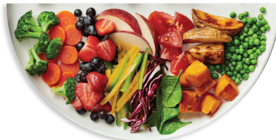
Figure 4. Assiette du Guide alimentaire canadien (fruits et légumes)

Les fruits et les légumes représentent une part importante d'un régime alimentaire sain. Ces types d'aliments renferment des nutriments essentiels pour les enfants en train de grandir, notamment des fibres, des vitamines et des minéraux. Le Guide alimentaire canadien recommande d'offrir des fruits et des légumes à chaque repas et collation, et d'incorporer toute une variété de fruits et de légumes de textures, couleurs et formes différentes.