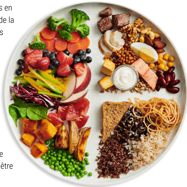
Figure 1. Assiette du Guide alimentaire canadien

Il est important de reconnaître qu'une alimentation saine ne se limite pas aux aliments offerts et englobe d'autres éléments de l'environnement d'alimentation et de l'heure des repas qui sont essentiels pour encourager les enfants à établir des rapports sains avec la nourriture. Les pratiques en question sont décrites plus en détail dans la section A (norme 7.0). La variété et la flexibilité sont essentielles pour encourager des choix alimentaires convenant à des besoins différents, comme les préférences alimentaires et les traditions culturelles en matière d'alimentation. La variété et la flexibilité devraient aussi être considérées en fonction du coût, mais non au détriment de la valeur nutritionnelle. On peut apporter des changements aux menus planifiés à condition que la substitution ait une valeur nutritionnelle comparable et réponde aux besoins alimentaires des enfants, y compris les allergies, les restrictions religieuses et culturelles, etc. Pensons par exemple à une substitution par une coupe différente de viande ou à la substitution par un fruit ou un légume de saison d'une valeur nutritive comparable. Les changements devraient être affichés au moins un jour à l'avance.