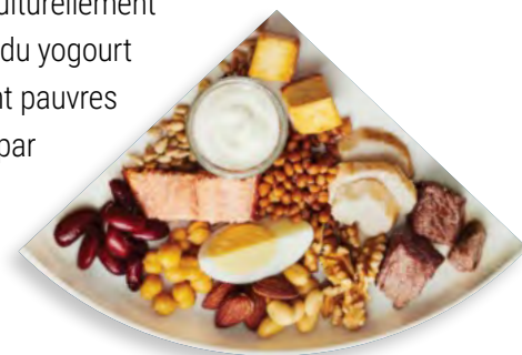
Figure 8. Assiette du Guide alimentaire canadien (aliments protéinés)

La personne titulaire de permis ou sa remplaçante peuvent incorporer les aliments en question à leur discrétion pour appuyer l'inclusion et la représentation d'aliments culturellement adaptés aux enfants au sein du programme. On peut offrir du fromage et du yogourt en guise d'aliments protéinés aux repas et collations, mais comme ils sont pauvres en fer, on peut seulement les offrir à titre d'aliments protéinés à un repas par semaine au maximum, et chacun peut être offert une fois par jour au maximum (y compris aux repas et collations).