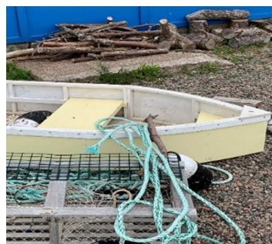
Figure 6: Garderie Les Petit's Poussin's Daycare Chéticamp, Nouvelle-Écosse