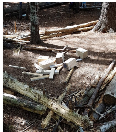
Figure 5: Jane Norman Family Home Agency Truro, Nouvelle-Écosse