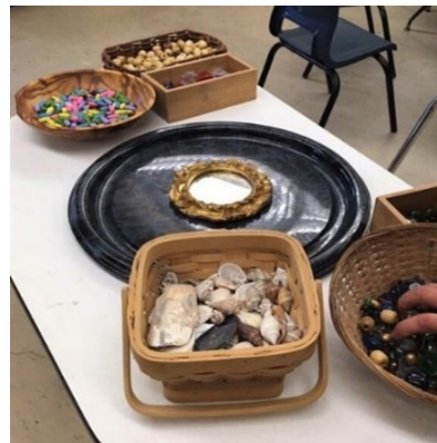
Figure 1: La P'tite Académie Church Pt, Nouvelle-Écosse