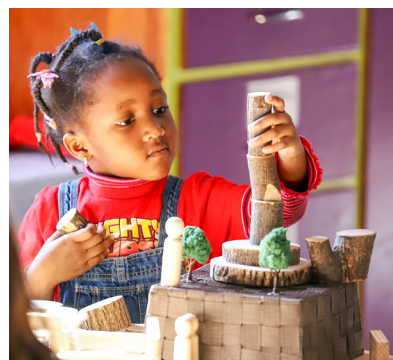
Figure 2: Programme de prématernelle, Halifax, Nouvelle-Écosse