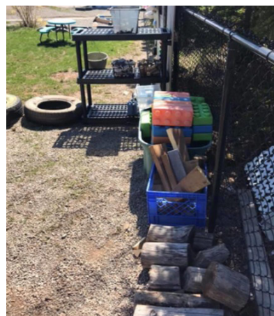
Figure 3: Health Park Early Learning Centre Sydney, Nouvelle-Écosse