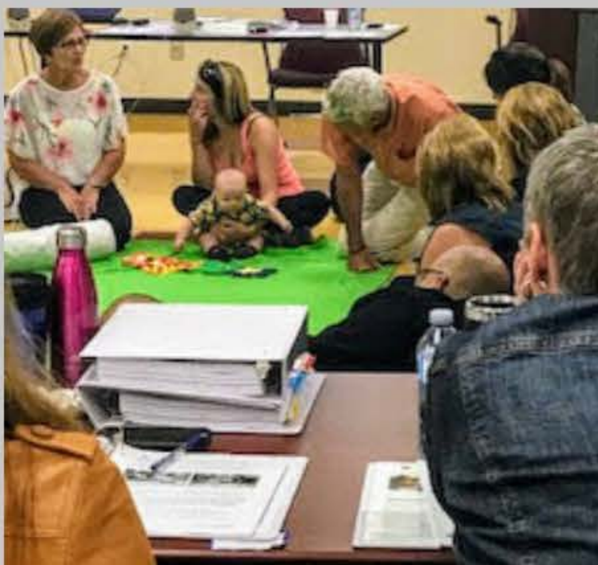
Maman avec son bébé participant à titre bénévole à la formation. Cela a été un moment marquant!