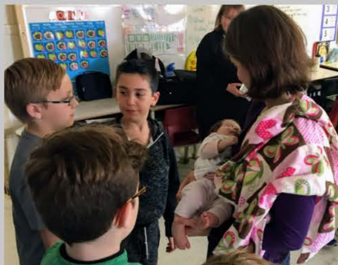
Le programme en action au HRSB!