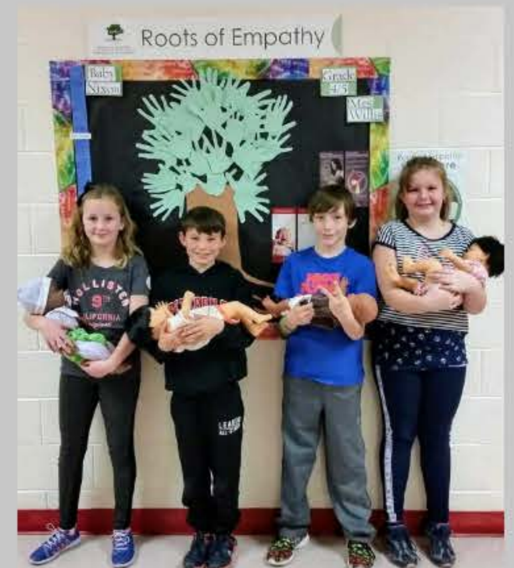
Élèves participant au programme avec ÉcolesPlus à Shelburne!